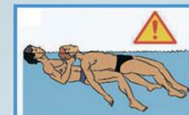
3. Убедись, что тебе ничего не угрожает. Извлеки пострадавшего из воды. (При подозрении на перелом позвоночника - вытягивай пострадавшего на доске или щите)