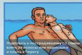
1. Первая помощь пострадавшему в воде