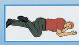
7. После восстановления дыхания и сердечной деятельности придай пострадавшему устойчивое боковое положение. Укрой и согрей его. Обеспечь постоянный контроль за состоянием!