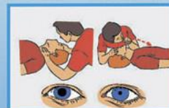
5. Определи наличие пульса на сонных артериях, реакцию зрачков на свет, самостоятельного дыхания.

Уложи пострадавшего животом на свое колено, дай воде стечь из дыхательных путей. Обеспечь проходимость верхних дыхательных путей. Очисти полость рта от посторонних предметов (слизь, рвотные массы и т.п.)