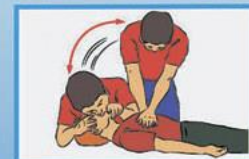
6. Если пульс, дыхание и реакция зрачков на свет отсутствуют - немедленно приступай к сердечно-легочной реанимации. Продолжай реанимацию до прибытия медицинского персонала или до восстановления самостоятельного дыхания и сердцебиения